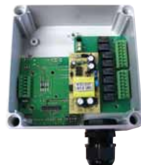
・02-8swRXRL-NWP 防水ケース入り 8接点用リレー付き端子台ボード*