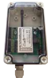
TS02-8swRX-NWP 防水ケース入り (IP65相当) 8接点用ワンタッチ端子台ボード*