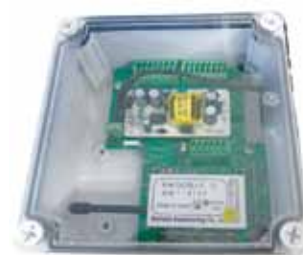
・02-16swRX-NWP 防水ケース入り 16接点用ワンタッチ端子台ボード* (16sw/8swループバック/8swアンサーバック対応)