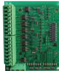
TS02-16swRX 16接点用ワンタッチ端子台ボード* (16sw/8swループバック/8swアンサーバック対応)