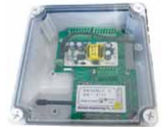
TS02-16swRX-NWP 防水ケース入り 16接点用ワンタッチ端子台ボード* (16sw/8swループバック/8swアンサーバック対応)