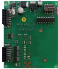
TS02-8swRXBD 8接点用ワンタッチ端子台ボード*