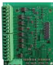
・02-16swRX 16接点用ワンタッチ端子台ボード* (16sw/8swループバック/8swアンサーバック対応)