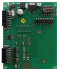
・02-8swRXBD 8接点用ワンタッチ端子台ボード*