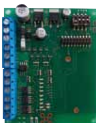
・02-8swRXBDS 8接点用スクリーン端子台ボード*