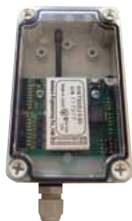
・02-8swRX-NWP 防水ケース入り (IP65相当) 8接点用ワンタッチ端子台ボード*