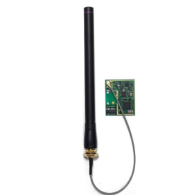
無指向性アンテナ 📍